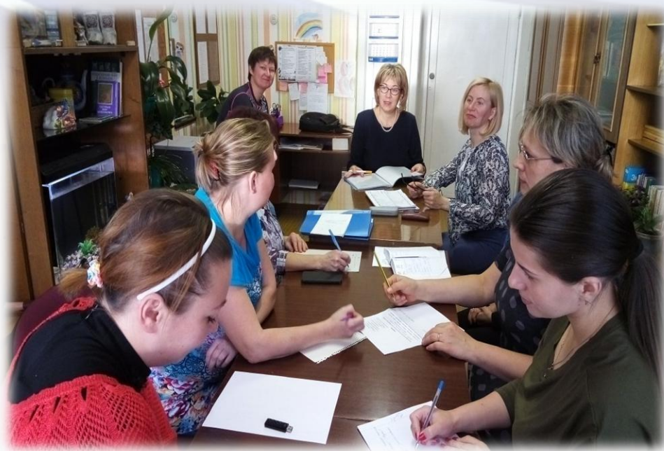
Проведение отчетно – выборного собрания